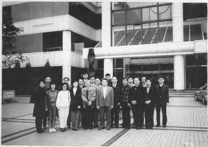
來臺訪問的北京隊拜訪聯華電子