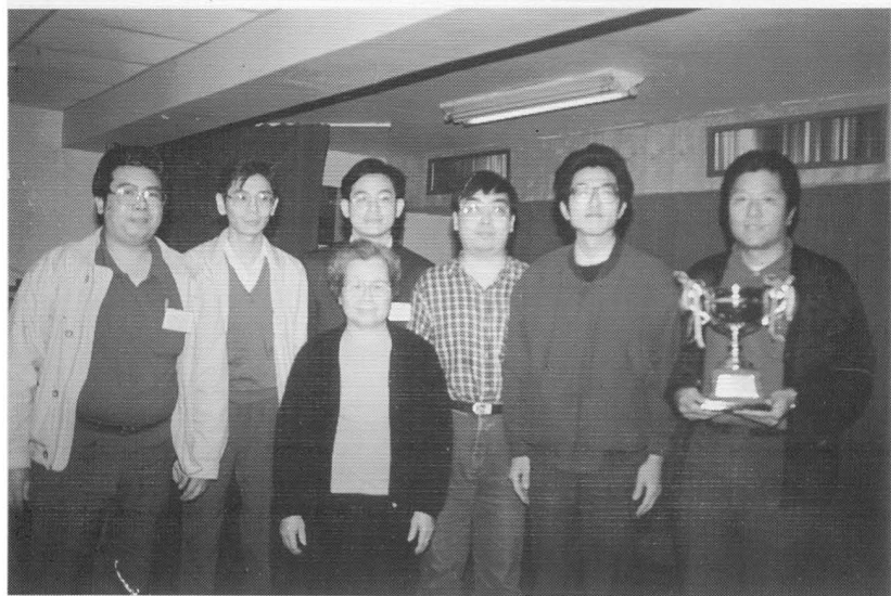
潤元杯橋士組論隊賽冠軍少林隊，許師母頒獎。