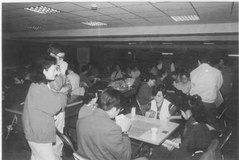
潤元杯賽場一角。(本期照片全為陳阿極橋友所攝)