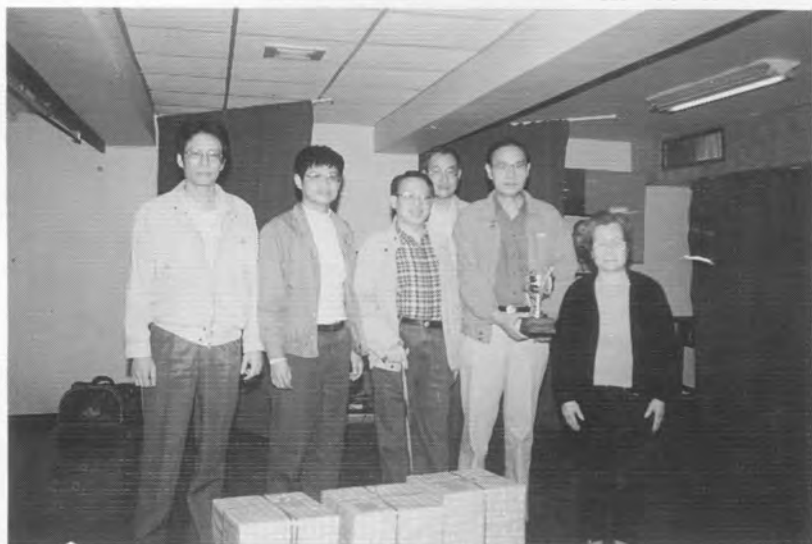
潤元杯橋士組論隊賽亞軍聚友隊，許師母頒獎。