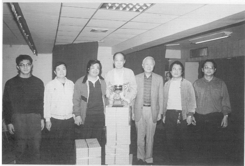
潤元杯公開組論隊賽冠軍世樺隊，張忠謀先生(右三)頒獎。