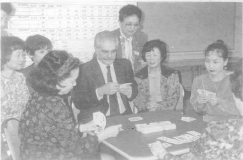
1991年世界杯期間，影星奧馬雪瑞夫與日本橋協職員玩橋牌