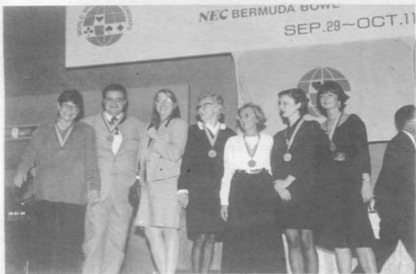
1991年威尼斯杯亞軍奧地利隊