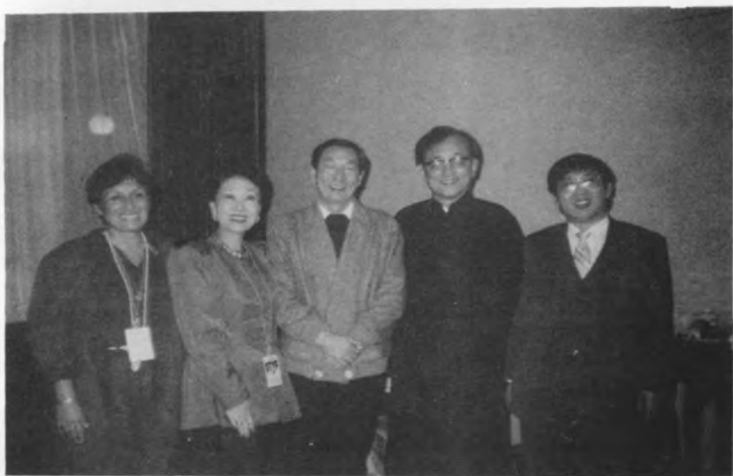
名人隊賽後與朱鎔基（當時為上海市長，目前為國務院副總理）合影