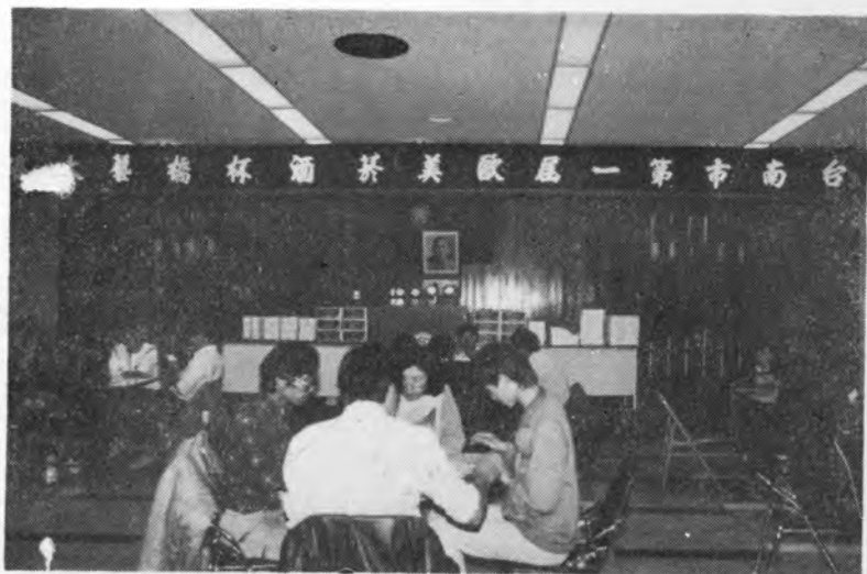
歐美菸酒杯大賽熱烈進行場面